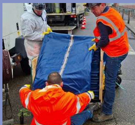
Chemisage de réseaux d'assainissement pour l'élimination des eaux claires parasites