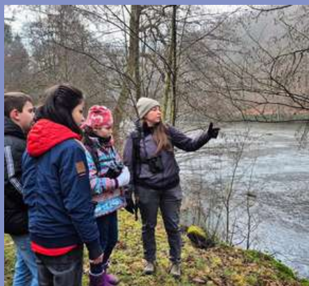
Sortie du CMJ avec le Parc naturel régional des Vosges du Nord le 24/01