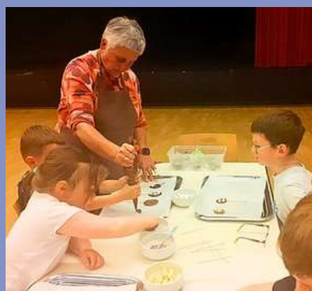
Animation tout chocolat avec le Point Lecture le 15/04