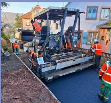
Aménagement de l'entrée du cimetière