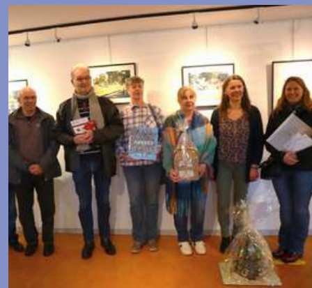
Remise des prix du concours photo 2025 le 06/02