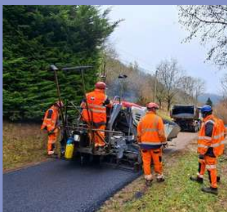
Réfection du tapis d'enrobé rue de la Chapelle