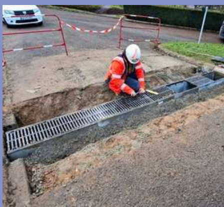
Zone de loisirs : remplacement d'un caniveau