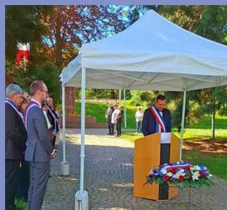
Cérémonie des victimes et héros de la Déportation le 26/04