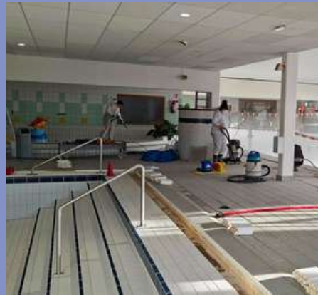
Travaux de maintenance à la piscine