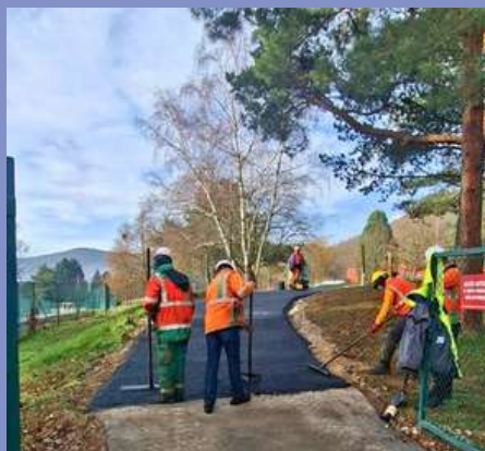
Aménagement de l'entrée vers les pistes de Pumptrack