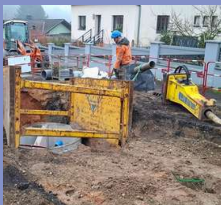
Renforcement du réseau d'assainissement rue des Châtaigniers