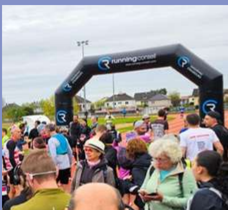
Courses Nature des Vosgirunners le 12/04