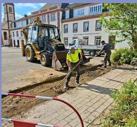
Réfection de l'enrobé place du Bureau Central