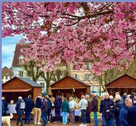
Marché de Pâques le 29/03