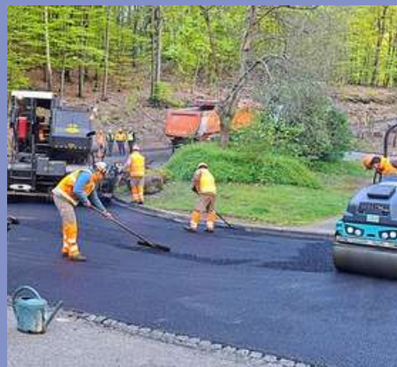
Réfection du tapis d'enrobé rue de la Lisière