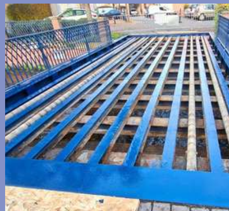
Parc du Casino : remplacement du platelage du pont