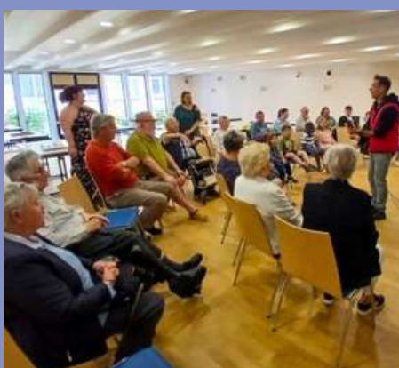
Après-midi jeux avec le service Qualité de Vie le 29/04