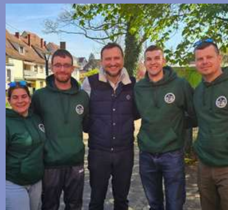
Nettoyage de printemps le 11/04