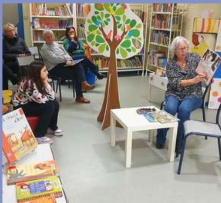
Nuit de la Lecture le 23/01