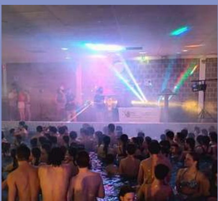
WinterParty aux Aqualies le 07/02