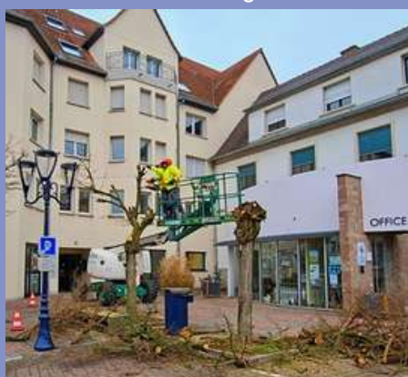
Aménagement des abords de l'office du tourisme