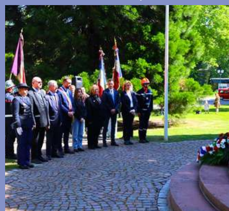
Cérémonie commémorative du 08/05