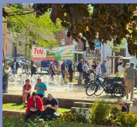
Fête de l'écotourisme le 01/05