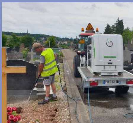
Désherbage à l'eau chaude au cimetière