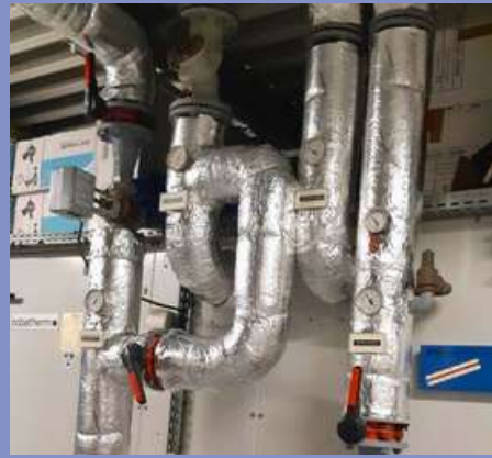
Travaux de calorifugeage des conduites à la piscine