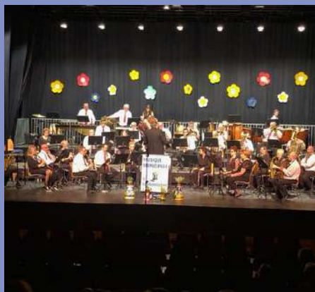
Concert de printemps de la Musique Municipale le 06/04