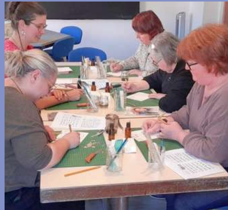
Atelier de fabrication d'outils d'écriture antiques le 06/04