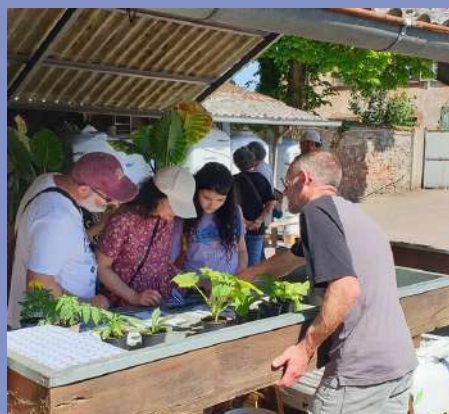
Présentation des serres municipales au public