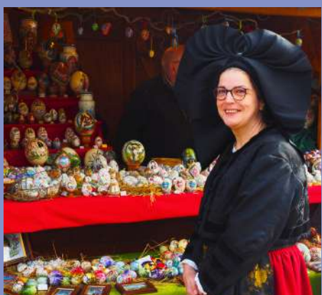
Marché de Pâques artisanal le 30/03