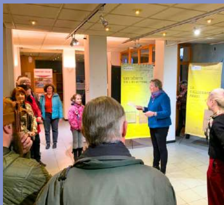
Vernissage de l'exposition "5000 ans d'écriture" le 28/02