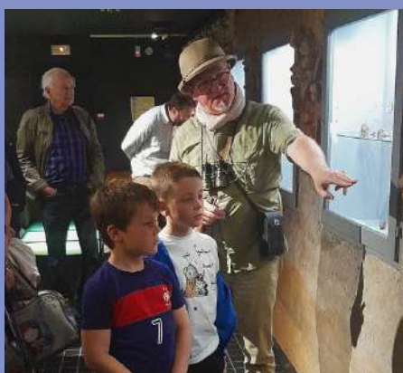
Nuit des musées le 17/05