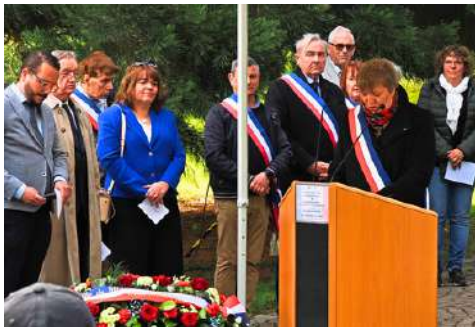
Thierry Perrin ©