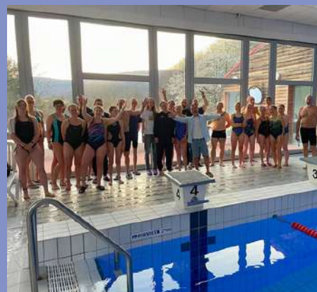
12h de natation aux Aqualies le 29/03