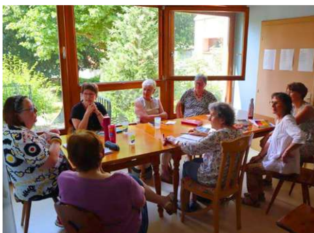
Rencontre du club de lecture