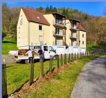
Chantier participatif de plantation de haies