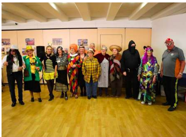
Thé dansant de carnaval