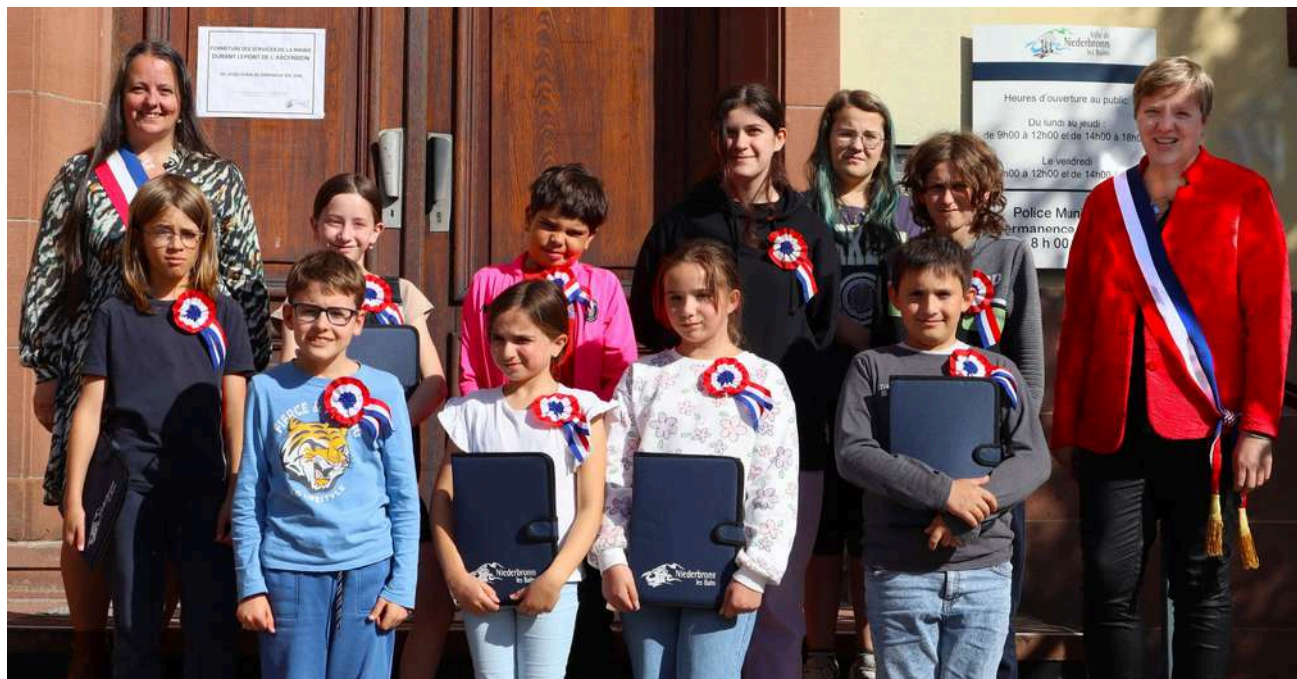
Élections du Conseil Municipal des Jeunes vendredi 23 mai 2025

Celle-ci définit les droits et les devoirs des jeunes conseillers municipaux, un cadre essentiel leur permettant de s'engager et de défendre des causes qui leur tiennent à cœur.