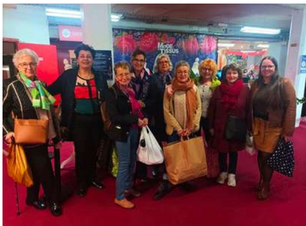
Visite des couturières au Salon Mode et Tissus 2025