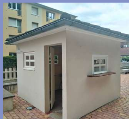
Rénovation de la guinguette du Herrenberg