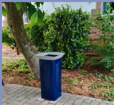
Remise en peinture des poubelles publiques