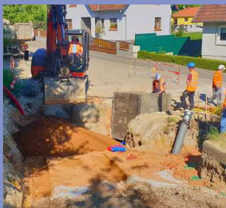
Chemin des Pierres : aménagement d'une aire de retournement et réfection de la voirie