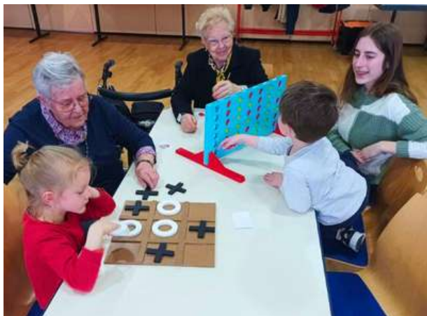
Après-midi jeux de société pour tous les âges