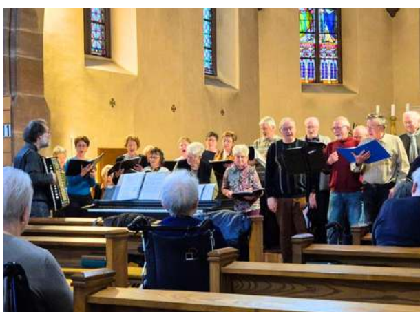
La Chorale Décì-Delà chante pour les résidents de l'Ehpad