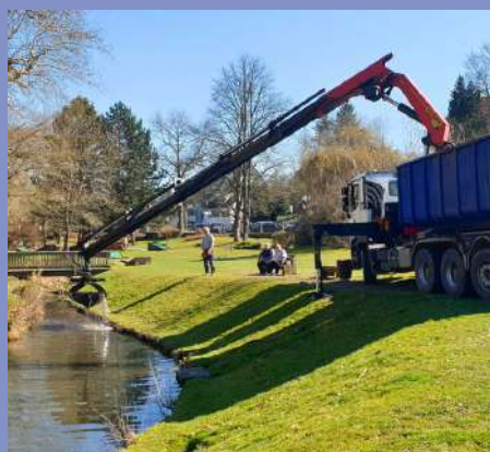
Parc du Golf : curage du grand bassin