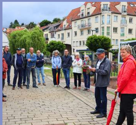
Inauguration de l'exposition Imagin'Air le 28/05