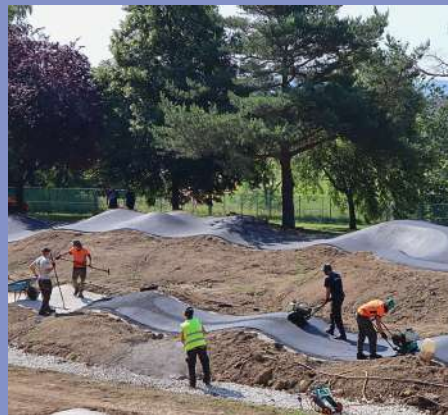
Réalisation de pistes de pumptrack et circuits vélos cross