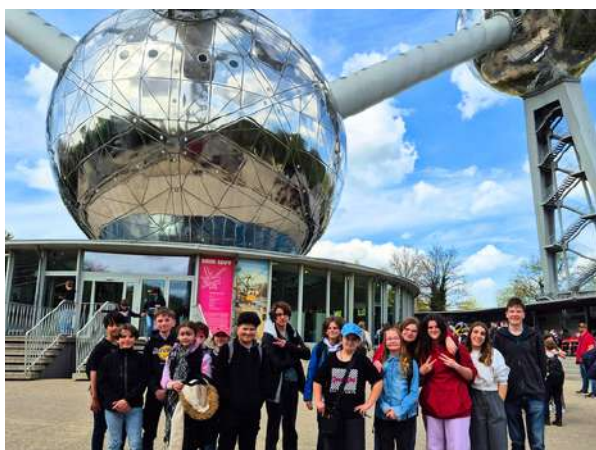
Séjour de 3 jours à Bruxelles en 2025

Les rencontres annuelles avec leurs homologues du territoire, leur permettant de confronter leurs idées et expériences, sont fort enrichissantes et particulièrement appréciées. Les visites de l'Assemblée Nationale, de la Maison de l'Europe, du Parlement Européen de Strasbourg, de la Collectivité Européenne d'Alsace ou du Musée de l'histoire européenne à Bruxelles ont permis à nos jeunes de se familiariser avec le fonctionnement des institutions. Avec la visite du Mémorial de Schirmeck et la pose récente des Stolpersteine, ils ont été confrontés à leur Histoire et sensibilisés au devoir de mémoire. Des exercices pratiques qui permettent de savoir d'où l'on vient et qui complètent de manière ludique l'enseignement pédagogique !