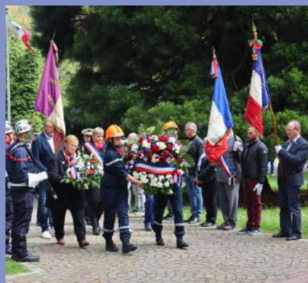
Cérémonie commémorative du 08/05