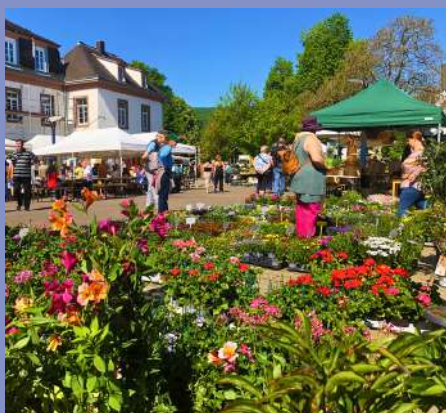
Fête de l'écotourisme le 01/05