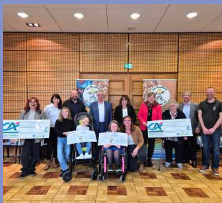
Remise de chèque aux Bouchons de l'Espoir le 26/04