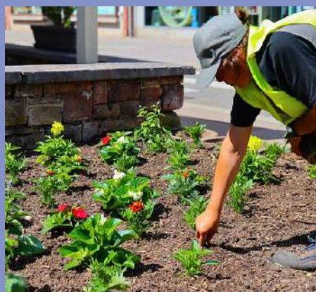
Fleurissement estival : 6 000 plants mis en terre