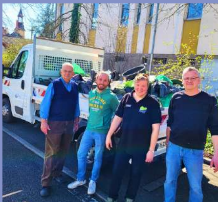
Nettoyage de printemps le 22/03