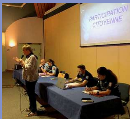
Participation citoyenne : réunion publique le 14/05