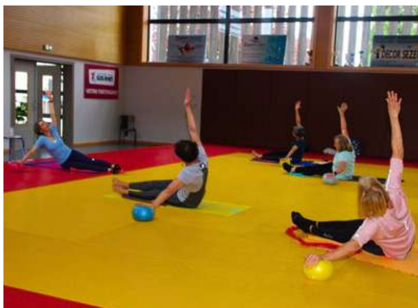
Gymnastique douce et pilates

Pour bien vieillir ensemble, il propose toute l'année (hors vacances scolaires) un large éventail d'activités favorisant la convivialité, la solidarité et l'épanouissement personnel.