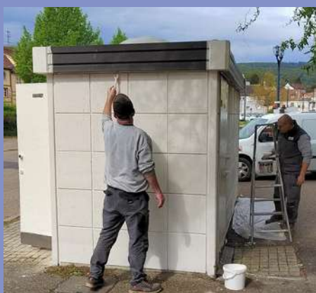
Remise en peinture des sanitaires publics