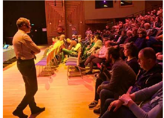
Succès de la conférence "L'écosystème de la forêt" animée par le biologiste Marc-André Selosse le 6 mai en présence de plus de 230 personnes

Lors d'une conférence gratuite à 20h au Moulin 9, Charles Frey, hydrogéologue, expliquera comment l'eau, depuis les sommets forestiers, arrive jusqu'à notre robinet. Une occasion rare de comprendre ce cycle invisible mais essentiel, dans un contexte où l'accès à l'eau potable est un défi crucial pour les générations futures.