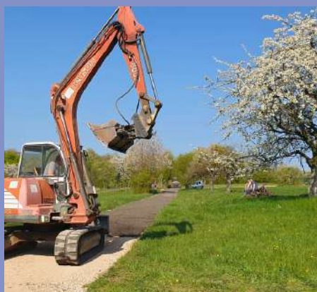
Rue d'Eymoutiers : remise en état du chemin rural