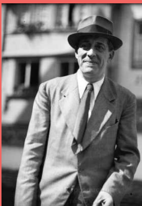
© Portrait Hans Haug par Lucien Blumer Archives de l'eurométropole de Strasbourg

Hans Haug, dont le nom est associé au groupe scolaire de notre commune, est une figure marquante du monde culturel alsacien. Né à Niederbronn-les-Bains le 1er décembre 1890, au n°1 de l'avenue Foch, il y a passé la majeure partie de sa vie.