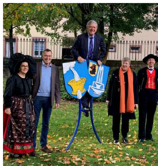
Célébration du 25e anniversaire du jumelage entre Bad Schönborn et Niederbronn-les-Bains le 12 octobre, en présence des maires des deux communes et de nombreuses délégations venues marquer cet anniversaire d'amitié franco-allemande