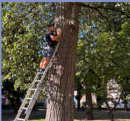
Installation de nichoirs (parcs du Casino et Golf)