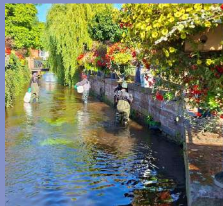
Nettoyage du Falkensteinerbach par les jeunes ICE