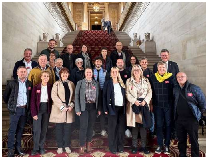
Une immersion au cœur des institutions : le conseil municipal remercie la sénatrice Elsa Schalck pour cette visite du Sénat le 22 octobre