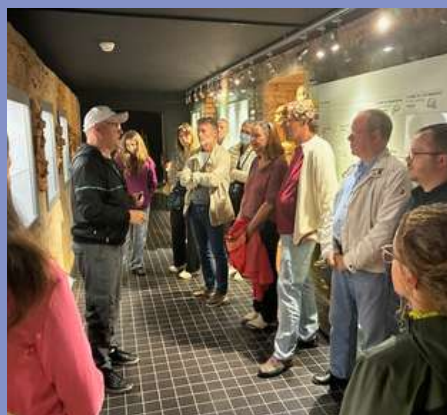
Journées du Patrimoine au musée les 20-21/09