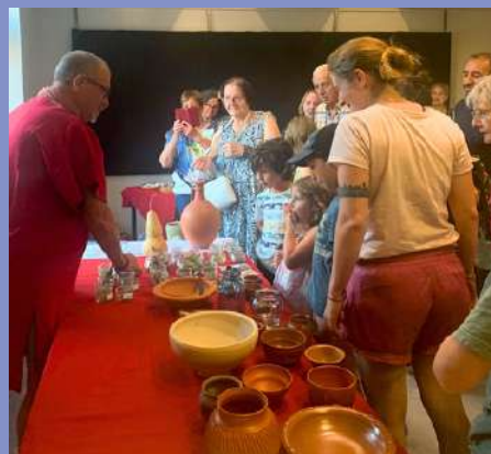
Petites histoires des Vosges du Nord le 12/08