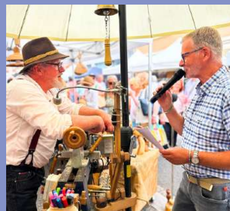
Festival de l'Artisanat le 20/07