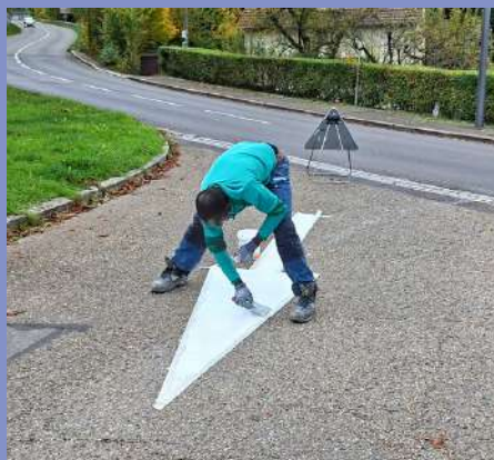
Travaux de marquage au sol dans la commune