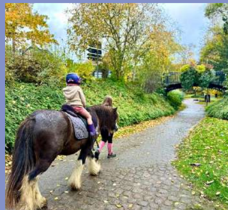
Fête d'automne et du terroir le 26/10