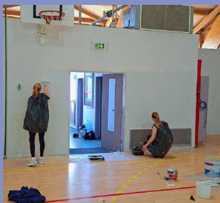
Remise en peinture des murs du gymnase par les jeunes ICE (grande salle)