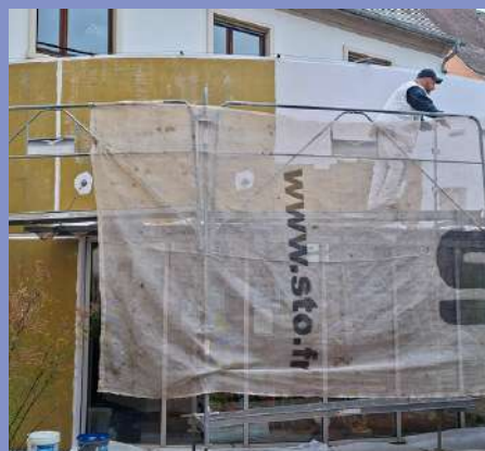
Office du Tourisme : rafraîchissement de la façade