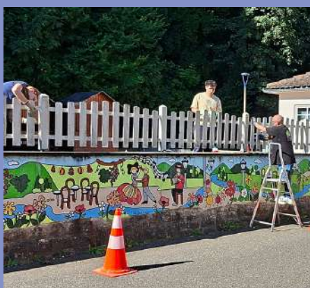
Remise en peinture du garde corps de la Guinguette