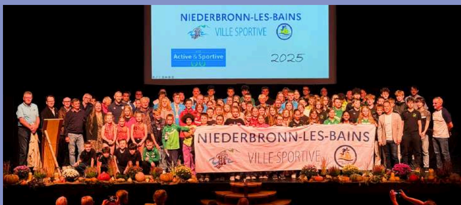
Cérémonie des Champions Sportifs 2025 le 03/10