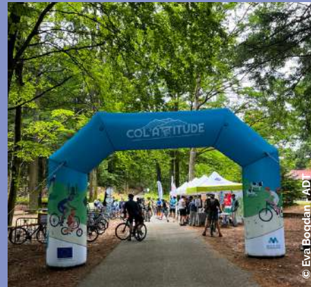
Col'Attitude le 31/08