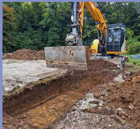
Fouilles archéologiques préventives pour l'aménagement d'un parking au Herrenberg