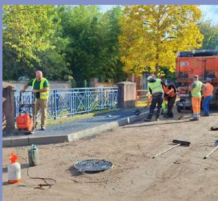
Sécurisation du pont de l'avenue Foch