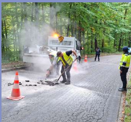
Réfection de nids de poule dans la commune