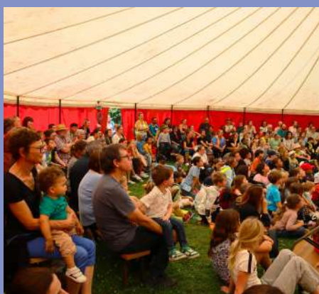
Mômes en scène du 30/07 au 03/08