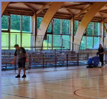
Nettoyage du gymnase : parquet et vestiaires