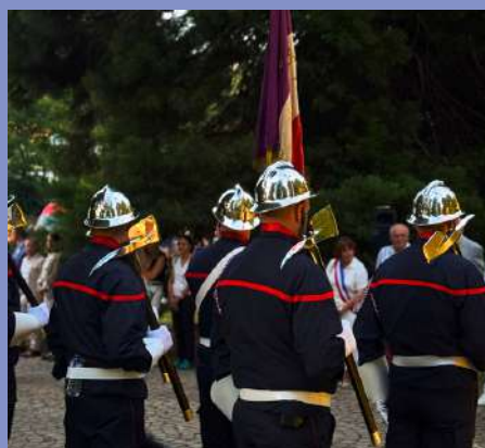
Nuit du Feu le 13/07