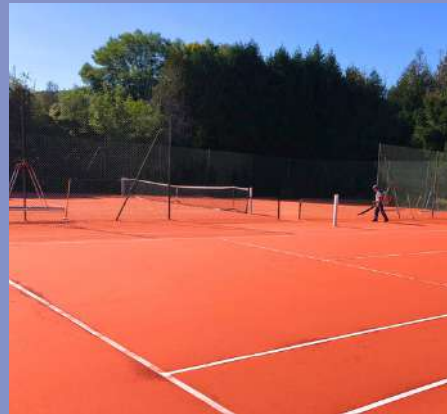
Réfection des courts de tennis