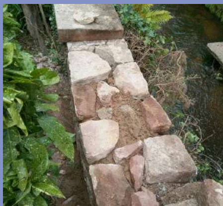
Réfection du mur le long du Falkensteinerbach