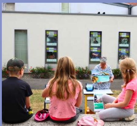
"Partir en livre" le 09/07