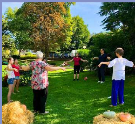
Week-end Bien-être les 20-21/09