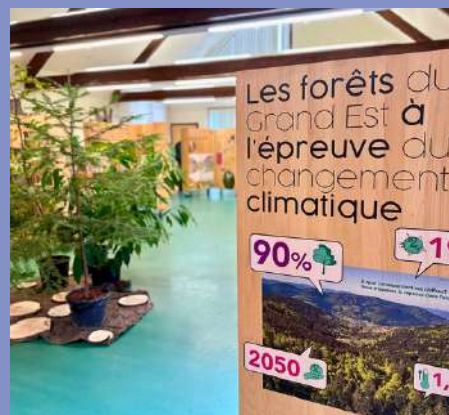
Exposition de l'ONF du 01/10 au 31/10