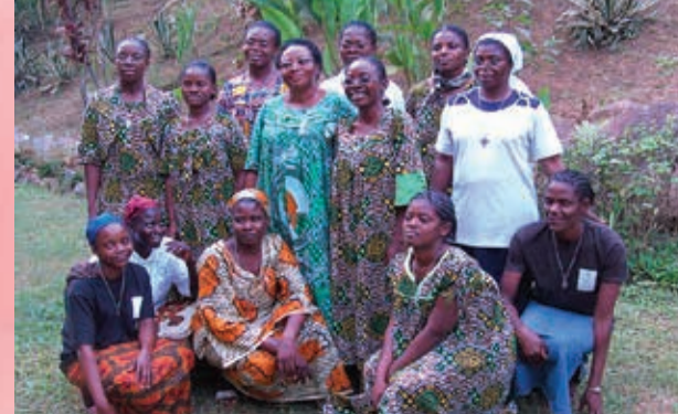
Des Sœurs africaines, en habit et en tenue locale