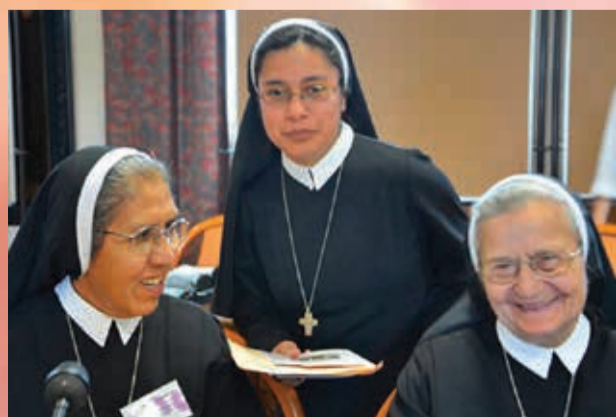
Des Sœurs d'Argentine, en habit traditionnel