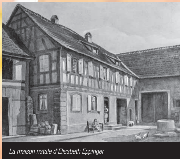
La maison natale d'Élisabeth Eppinger

Très pieuse dès son enfance, dotée d'une forte personnalité, Élisabeth décida de consacrer sa vie à Dieu. Et à son prochain. Les deux volets qu'elle a toujours associés. Aussi accourait-elle auprès des malades et des pauvres du village, avant même de penser à fonder sa propre congrégation. Avec l'aide de ses premières compagnes, elle soignait et réconfortait avec dévouement, sans distinction de condition sociale ni de religion.