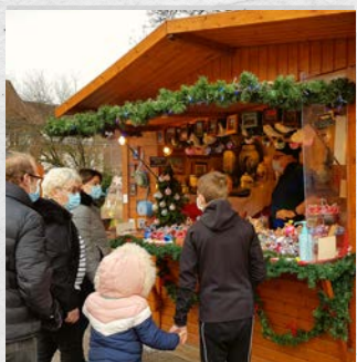
MARCHÉ HIVALNAL (3 PREMIERS WEEKENDS DE DÉCEMBRE)