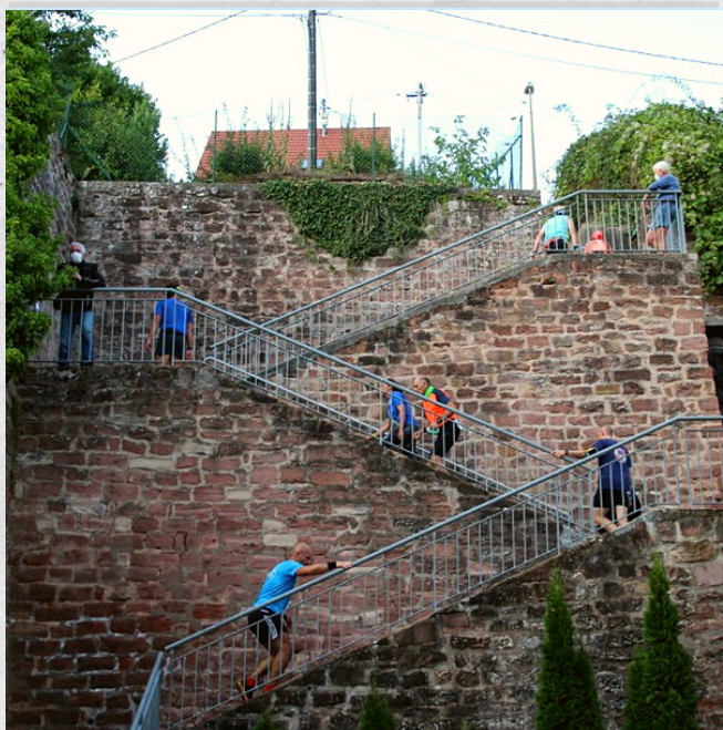
COURSE UTN ± 600 (11.09.20)