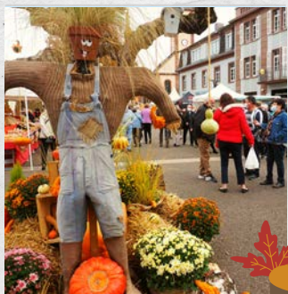
MARCHÉ D'AUTOMNE & DU TERROIR (25.10.20)