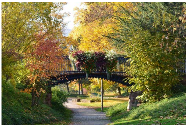
Parc du Golf

Les arbres retenus ne sont pas forcément des arbres remarquables (qui eux obtiennent cette dénomination en répondant à des critères très précis), mais ils font partis du paysage depuis très longtemps pour certains.