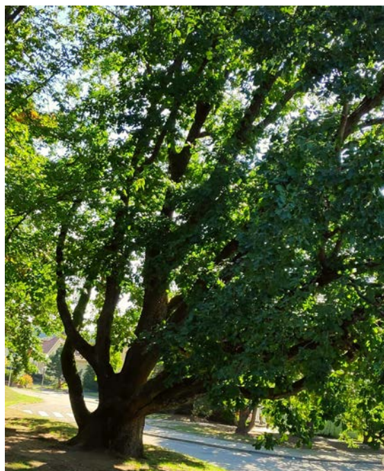
Chêne de Niederbronn-les-Bains, octobre 2020

Ils sont les témoins de notre histoire, singuliers par leur taille, leur forme, leur rareté sous nos latitudes.