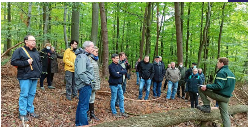
Sortie Forestière organisée par le SIVU du Massif du Wintersberg