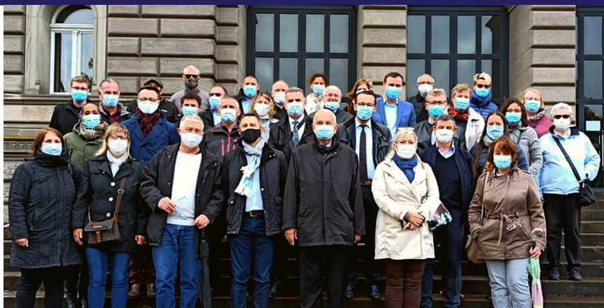
Déplacement des grands électeurs à Strasbourg pour les Sénatoriales