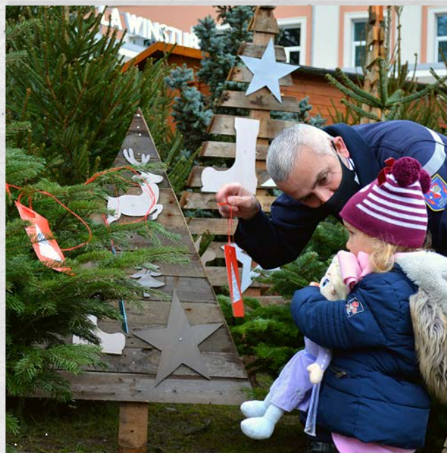
UN ARBRE À VŒUX POUR RÉALISER LES RÊVES D'ENFANTS